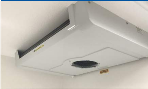
Platte kunststof verdamper