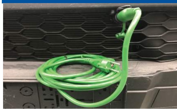
Uitbreiding met een 220 volt nachtkoeling is mogelijk, aansluiting in de cabine of geïntegreerd in de grill van de auto