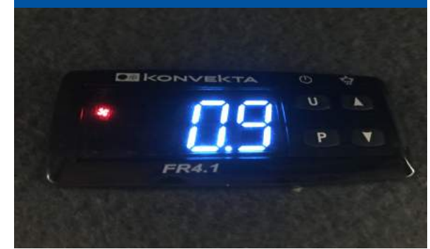
De installatie wordt vanuit de cabine bediend